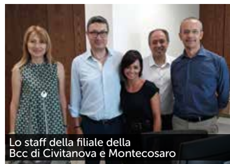
Lo staff della filiale della Bcc di Civitanova e Montecosaro

Edizione straordinaria! Venerdì 12 ottobre la classe del '58 si ritrova per festeggiare l'importante traguardo anagrafico. Appuntamento alle ore 20.30 presso l'osteria La Donzelletta in località Squartabue di Recanati per la cena seguita da un momento di festa. Sorpresa e animazione offerte da Alex informatica 3D, Castelfidardo. Per informazioni e prenotazioni, telefonare a partire dal 10 settembre al numero 3272057437.